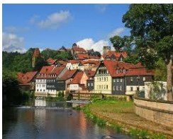
Kronach Festung Rosenberg und Altstadt