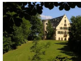
Rosenau in Rödental